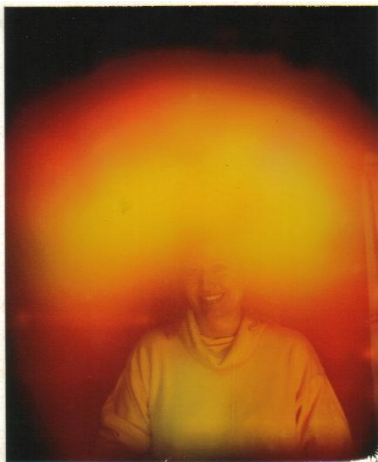
Foto hecha con una cámara alemana

Una mínima parte de esa energía se queda alrededor de nuestro cuerpo físico, se llama aura y la tienen todos los seres vivos. Gracias a unos investigadores, el matrimonio formado por Sayón y Valentina Kirlian que crearon la cámara Kirlian, se puede ver esa parte energética.