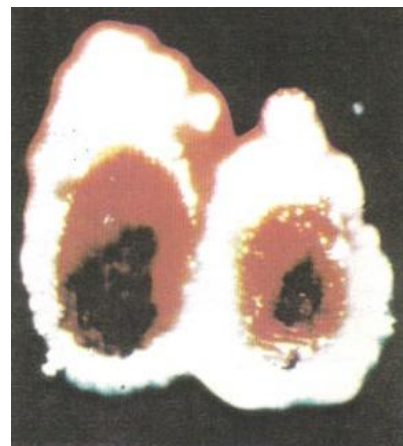
Foto de los dedos hecha con cámara kirlian

La foto del aura en color amarillo, demuestra que esta persona en ese momento está vital y muy mental. Ese color se forma en un momento determinado, no es su color real del aura. En ese momento estaba utilizando su mente, bajo del amarillo se ve el color real de su aura es de color rosa, aunque al mezclarlo con el amarillo se convierte en naranja. La siguiente es el aura de alrededor de los dedos de un drogadicto. La diferencia es considerable, casi no tiene color, está deforme y sucia. A la larga esa parte energética se convierte en enfermedad empezando por el órgano más débil y acabando eliminando la vida del cuerpo físico.